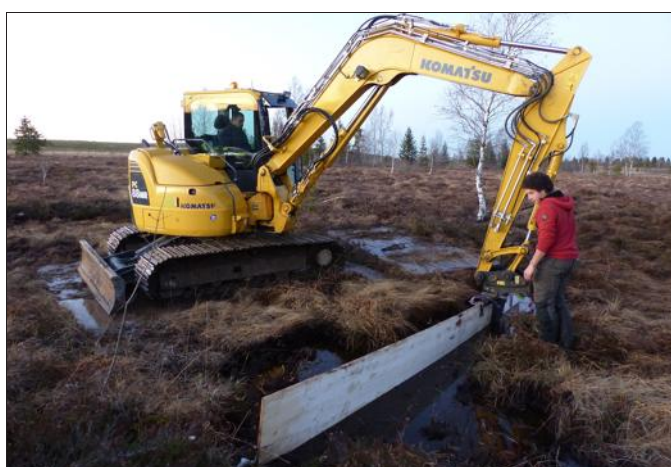
■ Les palissades retiendront les eaux d'écoulement pour alimenter les marais.

Ce chantier, comme le précédent, entre dans le programme Life tourbières du Jura qui le finance entièrement. Rendu possible par la météo exceptionnellement favorable du moment, il devrait être terminé d'ici la fin de la semaine. Et si les conditions restent favorables, un second chantier pourra être entamé pour le comblement de deux autres fossés