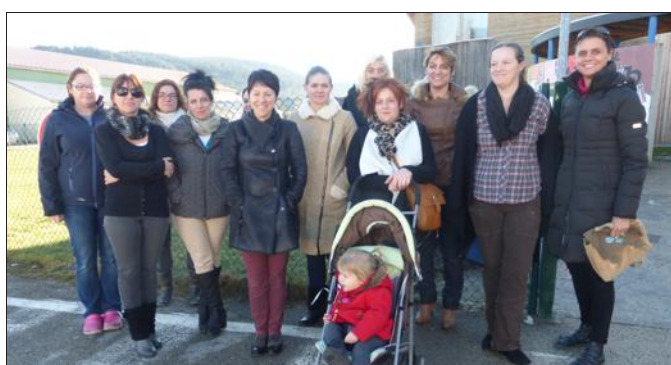
■ Une maîtresse qui revient de congé parental en mi-temps, une remplaçante qui s'en va, une autre qui arrive : la situation inquiète les parents qui se demandent comment les enfants vont réagir.

Les parents s'inquiètent de ces « chaises musicales » qui risquent de perturber les bambins. A l'initiative de quelques-uns, ils ont fait circuler une pétition qui a reçu l'aval de la majorité des parents. Un courrier a été adressé à l'inspection académique